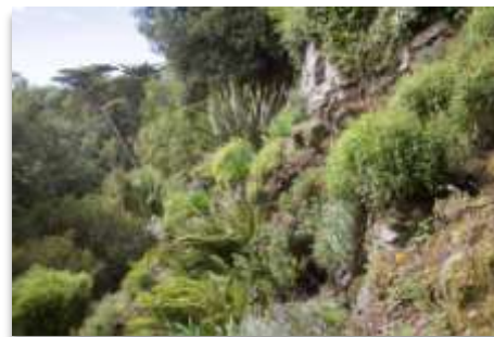
La rocaille