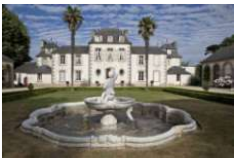
Le bassin de la cour d'honneur

Dossier de presse du Montmarin saison 2012