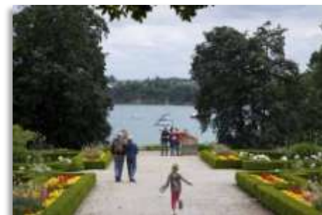
Entre terre et mer