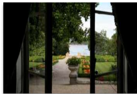
Vue sur la Rance