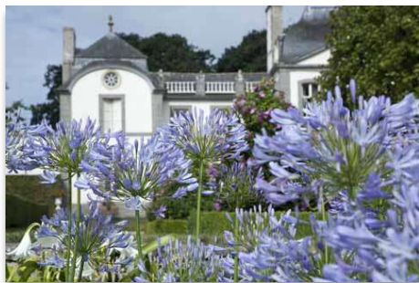
Les emblématiques agapanthes