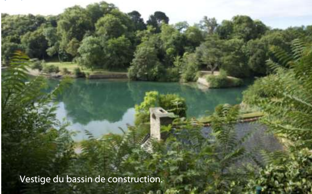
Vestige du bassin de construction.

En 1782, Benjamin Dubois, armateur, négociant, et constructeur de navires achète le domaine. Il profite de la situation exceptionnelle du site (baie abritée et profonde que constituait l'estuaire de la Rance) pour y installer un chantier naval d'où sortirent plus de 300 navires dont les bateaux de Bougainville, le célèbre explorateur passionné de plantes. Pendant cette période, les européens découvrent et collectionnent de nouvelles plantes venues du monde entier, tel le vénérable Magnolia grandiflora planté au pied de la malouinière. En 1813, Avec la disparition du commerce, Alexandre Dubois du Montmarin (le fils) transforme le bassin de construction en moulin à marée (qui ne sera détruit qu'en 1944). Il essaiera de maintenir une activité de construction navale jusqu'en 1845.