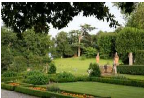
Le parc romantique (1)