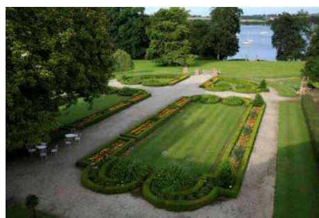
Les terrasses à la française