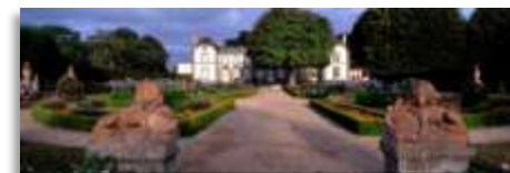
Panoramique des terrasses