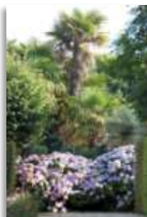
Palmier sur nuage d'hortensias