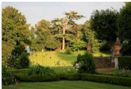
Le parc romantique (2)